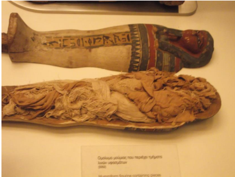
Два мумии, одна из которых покрыта красками и украшениями (1900) Mummium Scapula containing pieces