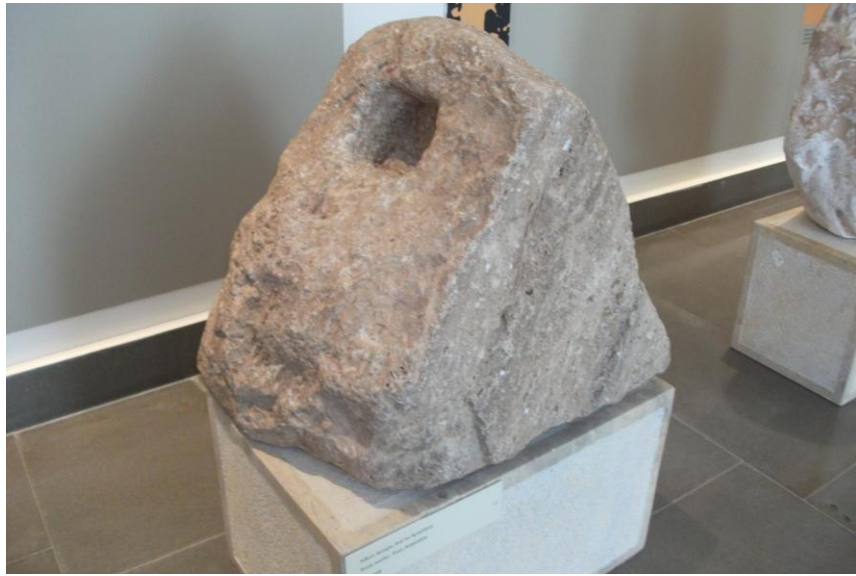
Εικόνα 5: Λίθινη Άγκυρα Πλοίου, Κλασική Περίοδος