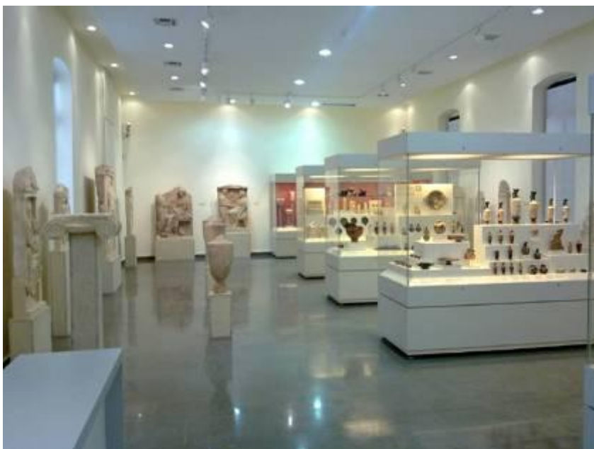
Εικόνα 1 Η Βόρεια πτέρυγα της κεντρικής αίθουσας (B) του Μουσείου