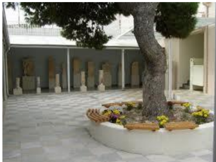
Εικόνα 2 Το κεντρικό αίθριο του Μουσείου