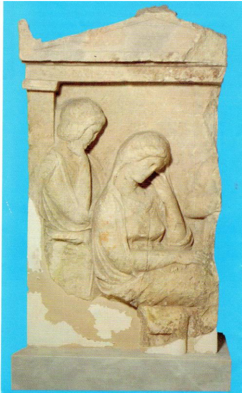
Εικόνα 4 Ταφική στήλη

επίσης τα επικασσιτερωμένα πήλινα αγγεία, μια σπάνια τεχνοτροπία που είχε σκοπό να μιμείται τα μεταλλικά δοχεία. Σημαντική είναι η συλλογή ευρημάτων που οφείλονται στην ανασκαφή του καθ. Ιωάννη Λώλου που είναι σε εξέλιξη στο «Μυκηναϊκό Ανάκτορο» και το «Σπήλαιο του Ευριπίδη». Πρέπει επίσης να σημειωθεί μια μεγάλη συλλογή αναθηματικών και επιτύμβιων στηλών και Ερμών η οποία εκτίθεται στο αίθριο του Μουσείου.