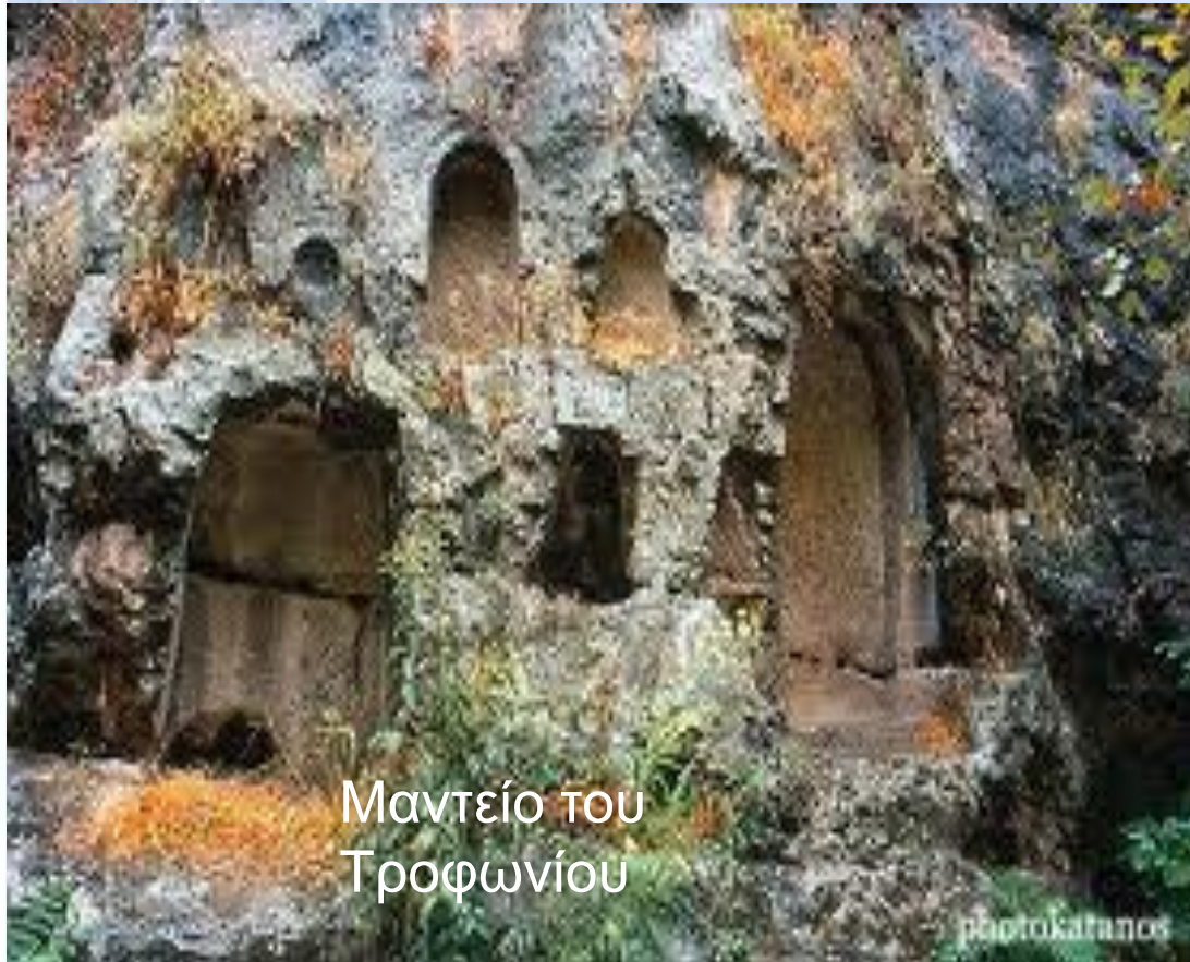
Μαντείο του Τροφωνίου