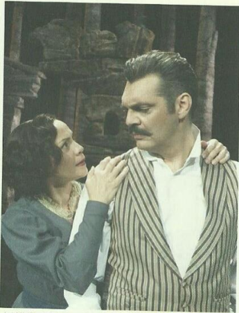
ΑΛΚΗΣ ΚΟΥΡΚΟΥΛΟΣ | ΑΛΕΞΑΝΔΡΑ ΣΑΚΕΛΛΑΡΟΠΟΥΛΟΥ