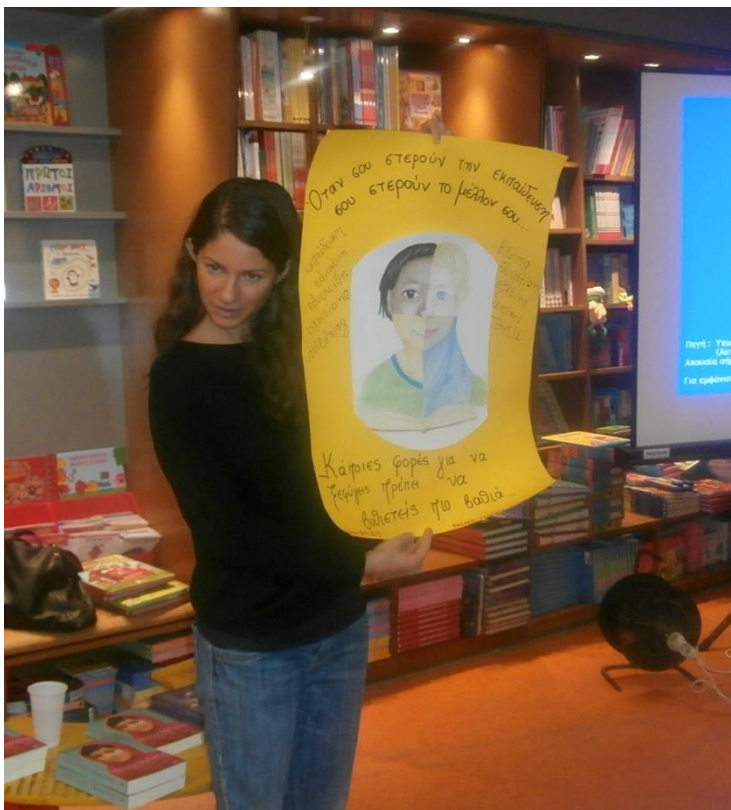
Η δημοσιογράφος και συγγραφέας Στέλλα Κάσδαγλη