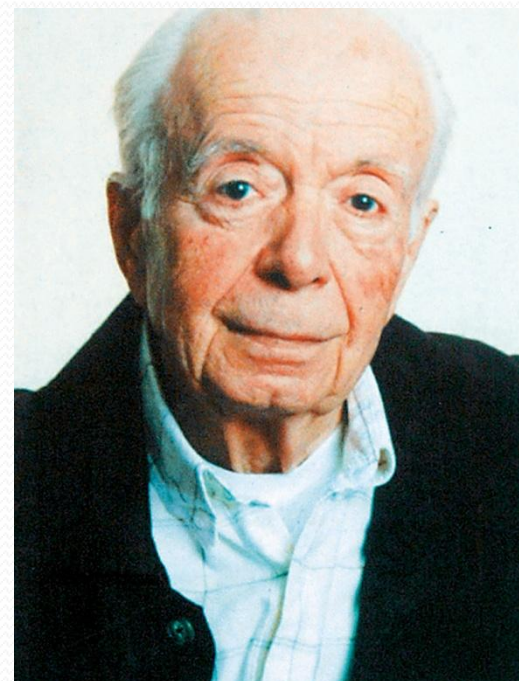
Ο Αντώνης Σαμαράκης