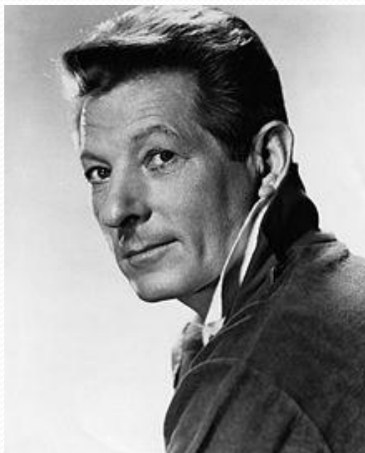
Ο Ντάνι Κέι