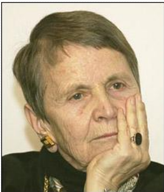
Η Ελένη Γλύκατζη Αρβελέρ