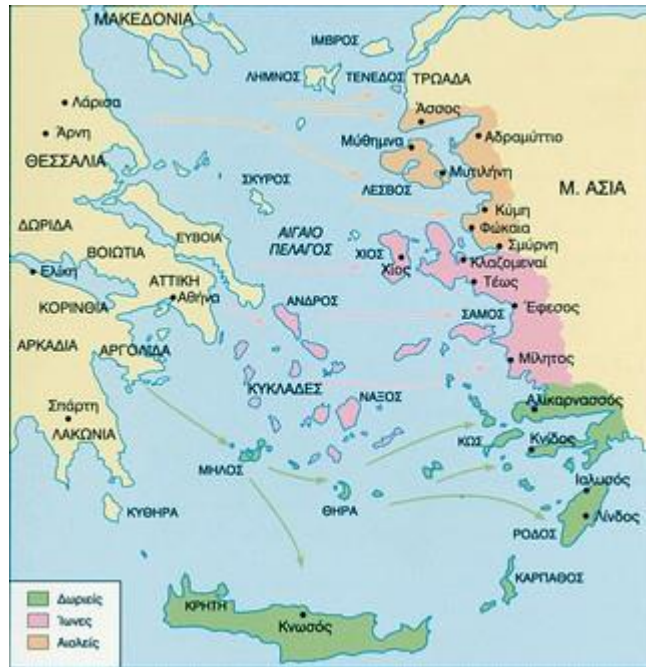
Α' Ελληνικός Αποικισμός

Η Μίλητος υπήρξε μία από τις παλαιότερες και σπουδαιότερες πόλεις της Ιωνίας, χτισμένη στις εκβολές του ποταμού Μαιάνδρου. Κατά τους αρχαίους χρόνους ήταν παραλιακή και διέθετε τέσσερα λιμάνια, ενώ σήμερα απέχει 9 χιλιόμετρα από τη θάλασσα, λόγω των προσχώσεων του ποταμού. Η παράδοση αναφέρει ότι στο β' μισό του 11ου αιώνα π.Χ. η πόλη αποικίστηκε από Ίωνες με αρχηγό τον Νηλέα, γιο του Κόδρου, στοιχείο που ενισχύεται από την εύρεση γεωμετρικού οικισμού. Η πόλη γνώρισε μεγάλη πνευματική και οικονομική άνθηση_ από εκεί κατάγονταν μεγάλες μορφές της αρχαίας ελληνικής διανοήσης, όπως ο Θαλής, ο Αναξίμανδρος, ο Αναξίμανης, ο Εκαταίος κ.ά. Στα τέλη του 7ου αιώνα π.Χ. εισήγαγε την κοπή νομίσματος από ήλεκτρο και ίδρυσε αποικίες, από τις οποίες σπουδαιότερες ήταν η Ναύκρατη στην Αίγυπτο, η Άβδος και η Κύζικος στην Προποντίδα, η Αμισός, η Σινώπη, η Τραπεζούντα, ο Ολβία και η Απολλωνία στον Εύξεινο πόντο. Η Μίλητος πρωτοστάτησε στην Ιωνική επανάσταση, που καταπνίγηκε με τη ναυμαχία της Λάδης (494 π.Χ.) και μετά την οποία η πόλη ισοπεδώθηκε από τους Πέρσες. Μετά τη ναυμαχία της Μυκάλης (479 π.Χ.) άρχισε η ανοικοδόμησή της με αφετηρία το ιερό του Απόλλωνα και τον ναό της Αθηνάς.