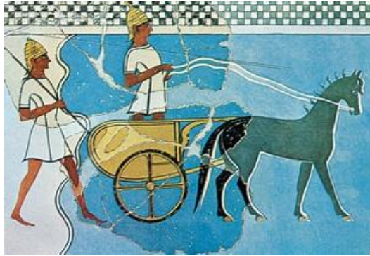
Τοιχογραφία από το ανάκτορο της Πύλου (Αθήνα, Εθνικό Αρχαιολογικό Μουσείο)