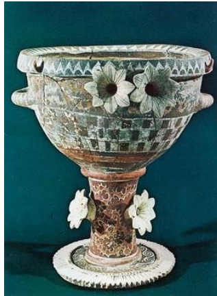
Καμαραϊκό κύπελλο με ολόγλυφα άνθη (Μουσείο Ηρακλείου).