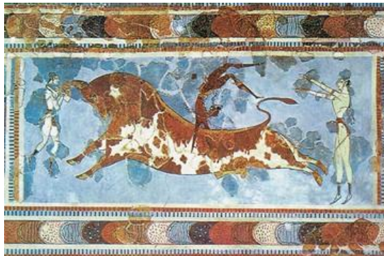
Τοιχογραφία από τα ανάκτορα της Κνωσού (Αρχαιολογικό Μουσείο Ηρακλείου)