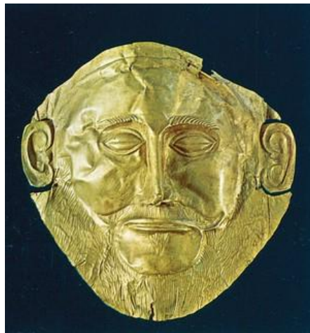
Χρυσή προσωπίδα από τους λακκοειδείς τάφους των Μυκηνών