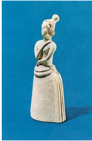
Πήλινο ειδώλιο γυμνόστητης γυναίκας (Μουσείο Ηρακλείου)