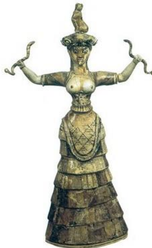
Η θεά των όφεων (Αρχαιολογικό Μουσείο Ηρακλείου)