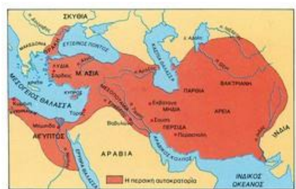
Η περσική αυτοκρατορία και ο ελληνικός κόσμος περί το 480 π.Χ.