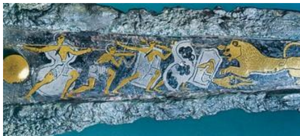
Εγχειρίδιο από τον λακκοειδή τάφο IV των Μυκηνών