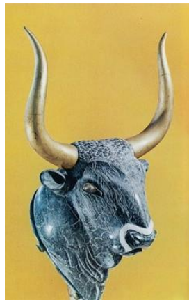
Ρυτό σε μορφή κεφαλής ταύρου (Μουσείο Ηρακλείου)