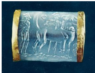
Χρυσόδετος σφραγιδολίθος με παράσταση λιονταριού και δαμαστών (Μουσείο Ηρακλείου)